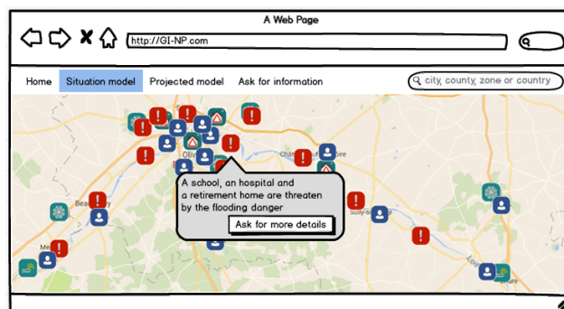
Figure 2. Une des interfaces utilisateurs, présentant le modèle de la situation.

Pour la suite, les utilisations de la solution IO Suite ou du prototype GénÉPi devraient permettre la constitution d'une base de connaissances regroupant les modèles de plusieurs situations de crise, à différent moment de la réponse. Si elle est utilisée, cette base de connaissance permettra à l'Interpreteur GénÉPi d'apprendre à déduire des relations de causes à effets via un raisonnement à partir de cas (« Case based reasoning ») (Bennani et al. 2017) ou des règles seuils au bénéfice du module Instantiate I.